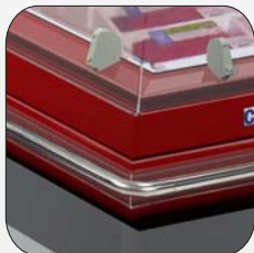
Batticarello in acciaio inox Stainless steel bumper rail Pare-choqs en acier inoxydable Wagenstoffleiste aus Edelstahl Parapogols de acero inoxidable Para-choques de aço inox